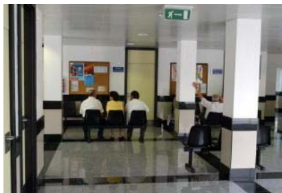
Varios pacientes esperan para ser atendidos en el centro de salud de Icod de los Vinos. José Luis González

L.P. | SANTA CRUZ DE TENERIFE Los médicos de Atención Primaria de las Islas cobran 3.400 euros al mes neto, según el estudio Retribuciones de cuatro tipos de médico de Atención Primaria Rural en España. Año 2008 elaborado por el Colegio de Médicos de Granada y del Consejo Andaluz de Colegio Médicos.