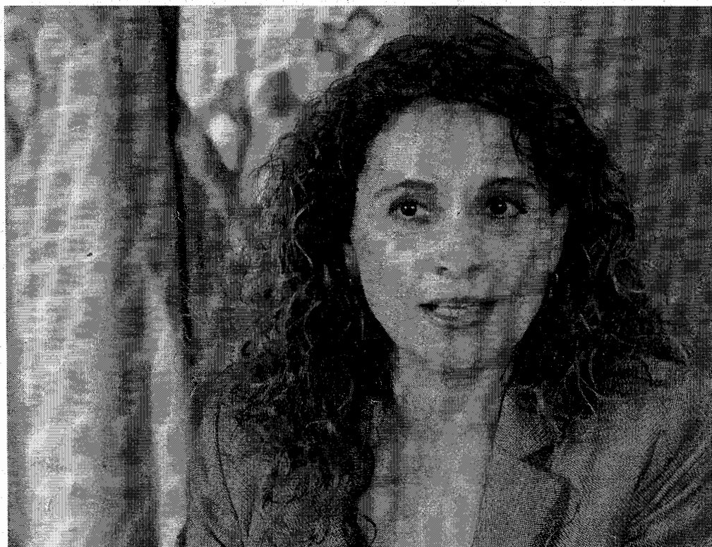
La consejera de Salud de la Junta, María Jesús Montero, en una imagen reciente