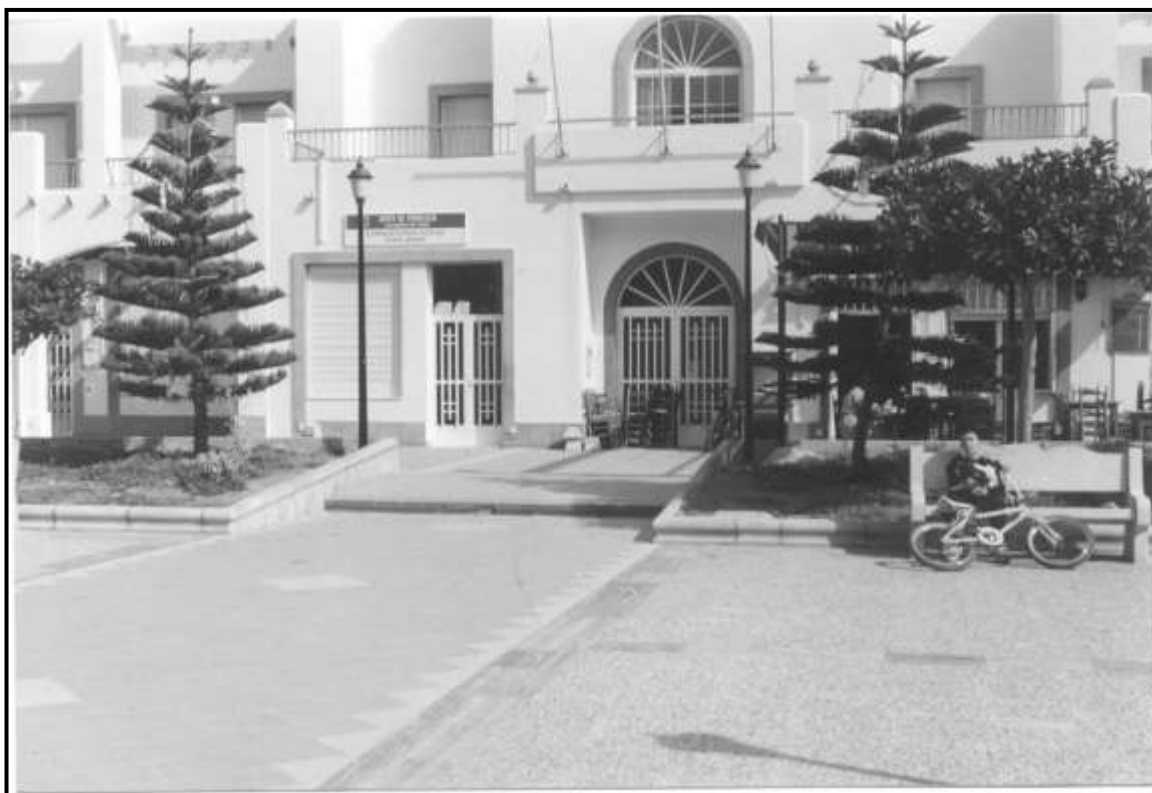
Consultorio Médico de San Jose-Nijar (Almería)

Plazas Oposiciones: Medicina General: 3 Pediatría: 2 Plantilla: Médicos Generales: 6 Pediatras: 1. Distancia a Granada Capital: Kilómetros: 154,9 Horas:1,51.