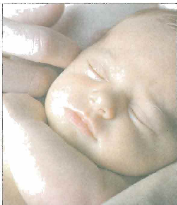
BANCO DE SANGRE Y TEJIDOS DE BARCELONA

Un neonato duerme en los brazos de su madre.