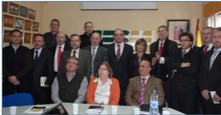
Los participantes en la reunión

Los profesionales de la Atención Primaria tienen ya un foro propio de la profesión: bajo el nombre de Casa Común de la Atención Primaria , OMC, CESM, la SEMG y otras sociedades científicas junto a las Comisiones Nacionales de la Especialidad, trabajarán conjuntamente a partir de ahora por la mejora del primer nivel.