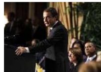
Zapatero cita la Biblia: "No explotará al jornalero pobre y necesitado"