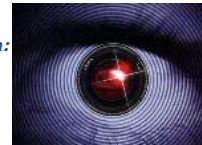
Teletrece inicia una nueva etapa de 'Gran Hermano'